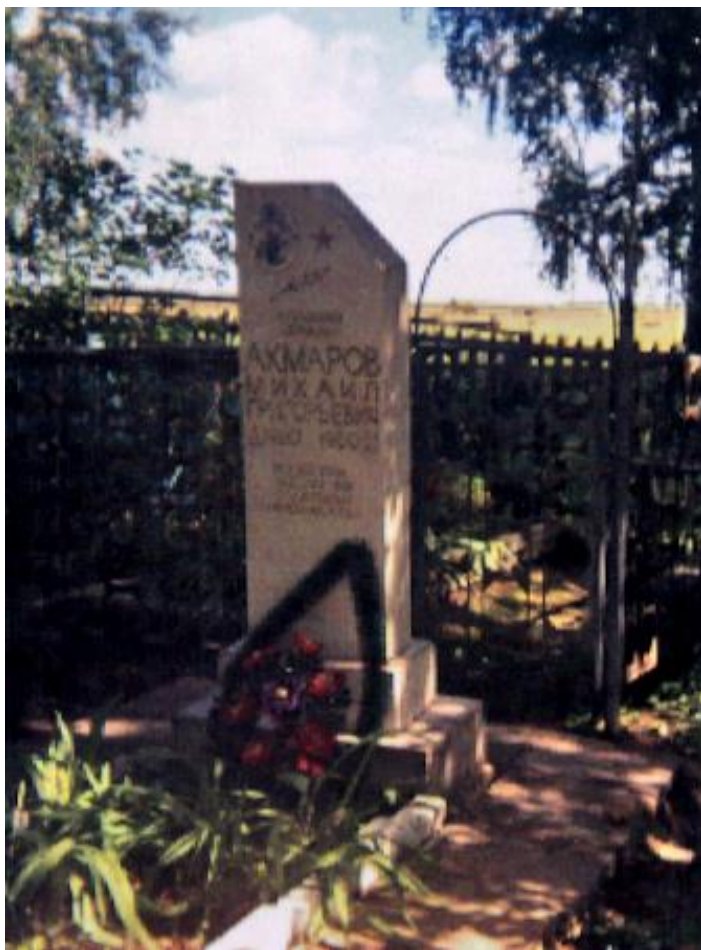
8. Фотоснимок захоронения.